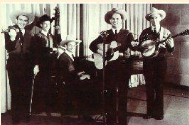
Western Swing de Bob Mills

Cette histoire peut se lire comme une légende... l'histoire en musique des États-Unis : aujourd'hui , intéressons-nous à la troisième étape: la musique que l'on a surnommé le Western Swing !